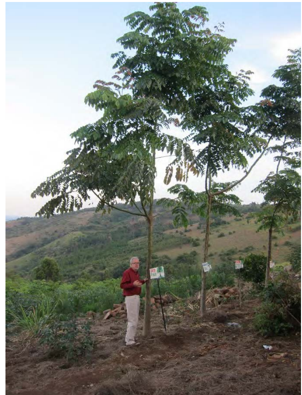
Een boomkwekerij en een boom (mihumula) van 4 jaar oud bij GEPAT

Zelf heeft Aurelia hier ook een soort gastenverblijf (a la Mugana) en heeft ze de hele helling volgeplant met verschillende soorten als demonstratieplantage. We worden ontvangen met dans en gezang en nemen onze intrek in de nog nieuwe compound. Na het eten sluiten we de dag af met het biertje op de veranda, een ritueel dat we iedere avond in ere hielden.